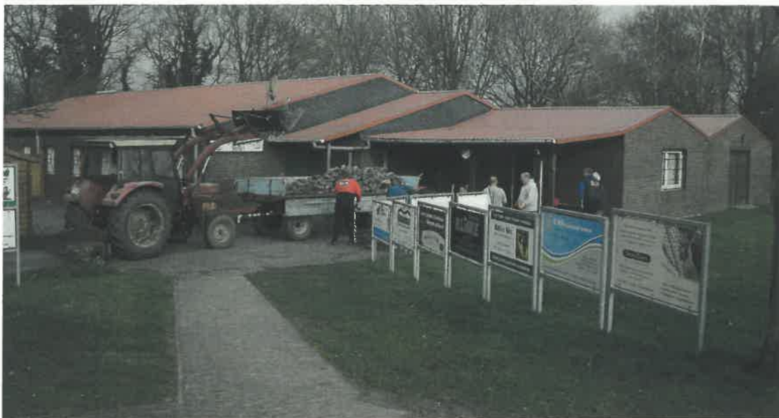
Im April 2018 wird die Zuwegung vom Clubhaus zum Sportplatz durch Legen neuer Steine komplett aufgenommen.